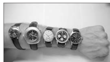
TID - Togtrafikken på strækning København-Århus natten til den 26. marts vil blive påvirket af overgangen til sommertid.

TRANSPORT Natten mellem lørdag den 25. marts og søndag den 26. marts går Danmark over til sommertid, og det kommer til at påvirke togene mellem København og Århus. Kl. 2.00 bliver urene stillet frem til kl. 3.00, og det berører de tog, som afgår i normaltid, men ankommer i sommertid. De vil på papiret være en time forsinket, selv om rejsetiden ikke forlænges. Det er især InterCity tog mellem København og Fyn-Jylland og videre til Århus, der bliver påvirket, oplyser DSB. Det gælder således afgangene fra Københavns Hovedbanegård kl. 23.30, 0.30 og 1.16 til Århus, der ulykkeligvis bliver en time forsinket som følge af overgangen til sommertid. InterCity toget fra København kl. 2.06 får afgang kl. 3.06 (sommertid). InterCity toget fra Jylland med ankomst til København kl. 2.25 ankommer kl. 3.25 (sommertid). InterCity toget fra Århus kl. 2.00 mod København afgår kl. 3.00 (sommertid), men bliver suppleret af en rettidig afgang fra Fredericia kl. 3.12 (sommertid) til København. Planerne for de tog, der bliver påvirket, fremgår af DSB's hjemmeside www.dsb.dk under emnet "Køreplaner og trafikinformation". jkj